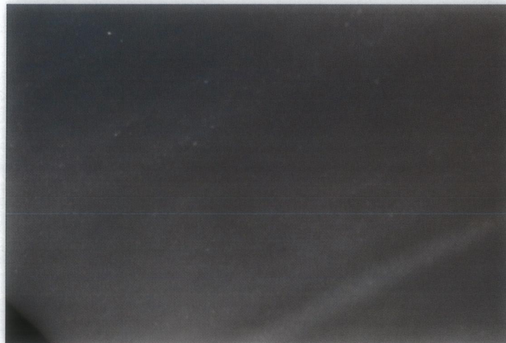
Foto 2: Untersuchungsmaterial Soudaseal Cleanroom nach einer Inkubationszeit von 28 Tagen ohne Pilzwachstum (50fach vergrößert)